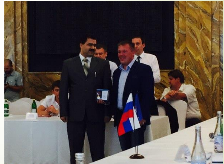
Тржественное вручение медали «За содействие органам наркоконтроля»